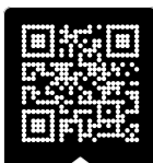
PRESS KIT 2026